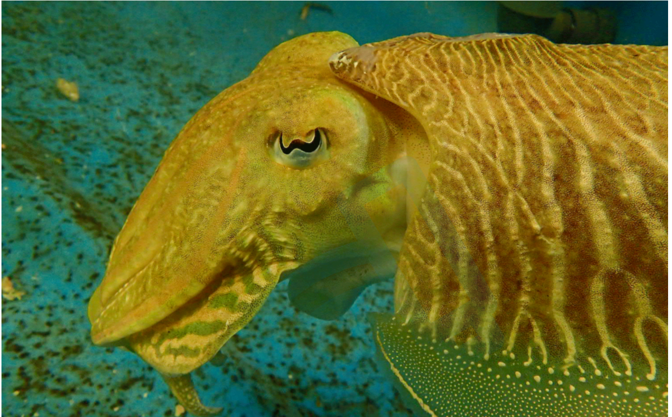
Seiche mâle adulte

retenir un chemin pour atteindre un abri.