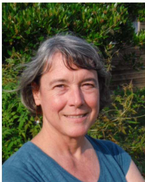
Cécile Bellanger ©EthoS