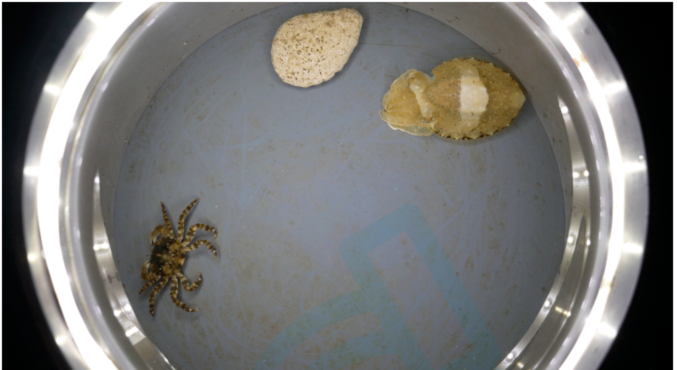
Seiche juvénile face à une proie